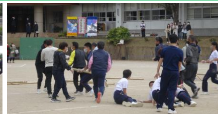
引きずられても離さないこの執念！ 「ソーシャルディスタン棒引き」 3年VS 保護者は、保護者の圧勝！