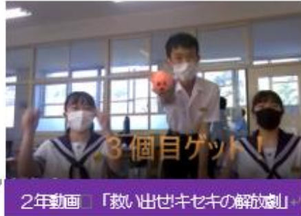
2年動画 「救い出せ!キセキの解放劇」