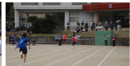
真剣勝負！：「100m走」 全生徒による「ブロック対抗全員リレー」：観衆の待つゴールへ一直線！