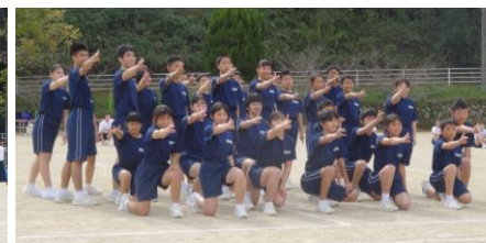
生き生きとした若さあられる全校生徒によるダンス！ アンコールもかかりみんな笑顔で踊りきりました！