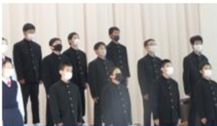
1年合唱 「明日を信じて」