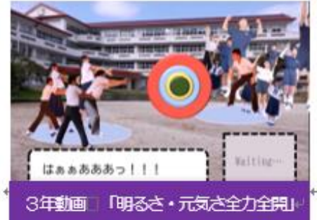
3年動画 「明るさ・元気を全力全開」