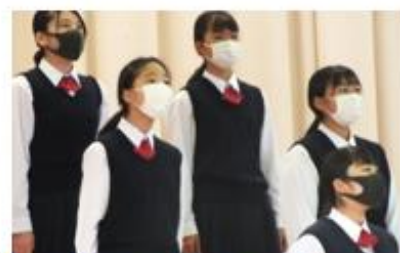
2年合唱 「大切なもの」