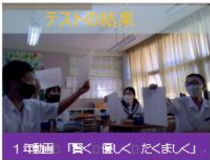
1年動画 「賢く、優しく、たくましく」

2年ぶりの開催となった合唱コンクールは、最初はどうなることかと心配していましたが、当日は素晴らしい合唱を響かせてくれました。朝から各教室で発声練習を重ねて臨んだ本番。1番目は2年生。これが規準となる合唱でしたが、今までで一番素晴らしい歌声でした。これが1年生にも伝わり、最後は3年生が低音の重量感とソプラノの響きで締めくくりました。ぜひ多くの方々に生で聴いていただきたい演奏でした。