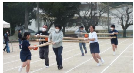
「ソーシャルディスタンスみこしリレー」：全ての保護者の皆様に参加していただき、大盛り上がりでした。