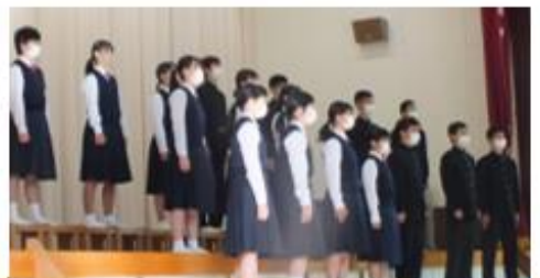
3年合唱 「時を超えて」